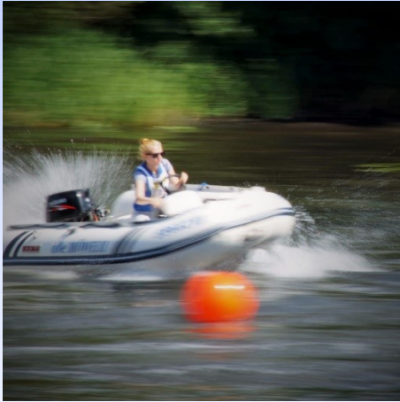
Fahrerin in Aktion, Jugendpokal im Schlauchbootslalom